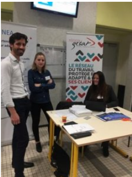
Espace d'exposition du GESAT et son équipe

De plus, face à la transformation numérique, il est intéressant de s'informer sur les atouts de cette économie du double point de vue de ses capacités d'innovation et d'adaptation aussi bien techniques que sociales et sociétales. »