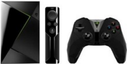
SHIELD TV avec télécommande à recherche vocale et manette de jeux Controller inclus