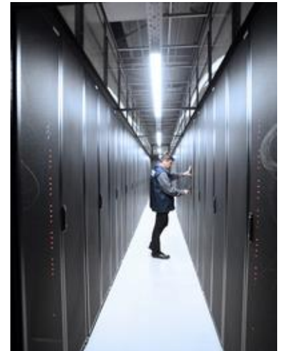
Salle IT en îlots confinés hot corridor