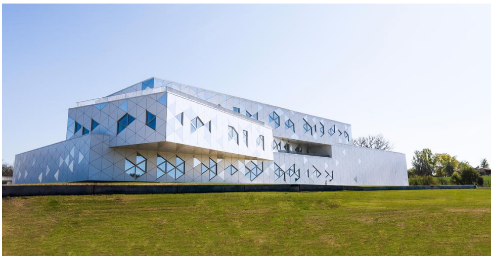
Une enveloppe digitale, un site singulier : le Fil d'Ariane a été conçu par REC Architecture

Sa construction représente un investissement global de 10 M€ et a mobilisé plus d'une quarantaine d'entreprises (titulaires et sous-traitants), toutes issues du tissu économique local et régional. L'architecture du bâtiment est l'œuvre du Cabinet Rec Architecture.