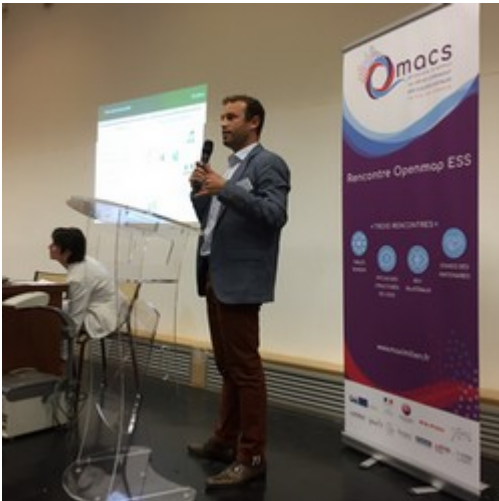
Séance de pitch de Nodixia

Six structures de l'ESS appartenant au secteur du numérique, sélectionnées au préalable sur dossier, ont été invitées à présenter leurs solutions et leurs projets innovants lors d'une séance de pitches.