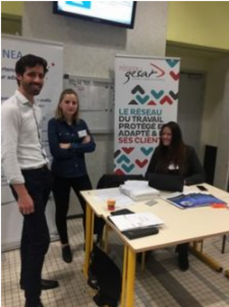
Espace d'exposition du GESAT et son équipe

En parallèle à cette séance de networking, une douzaine de partenaires – acteurs publics, représentants de l'ESS et du monde économique – ont accueilli les participants sur leurs espaces d'exposition.