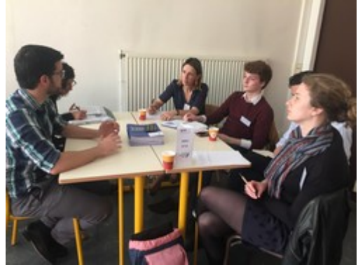
Entretien bilatéral entre une structure ESS et la Société du Grand Paris

Puis les acheteurs publics franciliens et les structures ESS ont pu échanger dans le cadre de rendez-vous bilatéraux (networking) sur leurs besoins respectifs, leurs offres et bien entendu les projets d'achats publics dans les mois à venir.