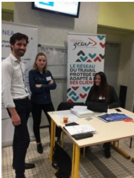
Espace d'exposition du GESAT et son équipe

peuvent répondre à nos besoins à court et moyen terme. De plus, face à la transformation numérique, il est intéressant de s'informer sur les atouts de cette économie du double point de vue de ses capacités d'innovation et d'adaptation aussi bien techniques que sociales et sociétales. »